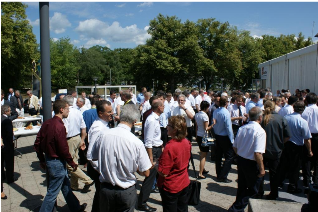
Pour fêter le premier salon swissT.fair en Romandie, les exposants se sont retrouvés à l'apéro d'ouverture.