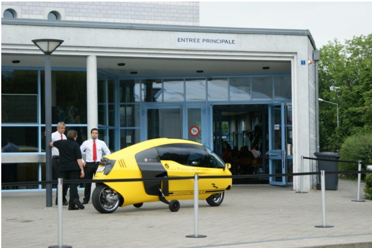
Trois visiteurs se sont réjouis de leur virée à bord du MonoTracer MTE-150 de l'entreprise Peraves de Winterthur.