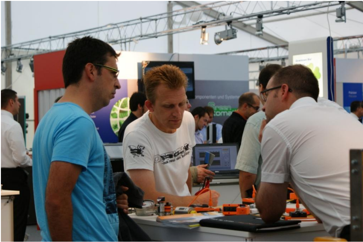
Le salon a offert la possibilité idéale de nouer des contacts et de se faire conseiller.